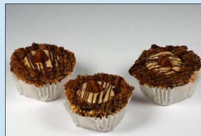
Пирожное «корзиночки» С начинкой на выбор Цена: 60 руб.