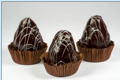
Пирожное «Горка» 100 гр. Цена: 70 руб.