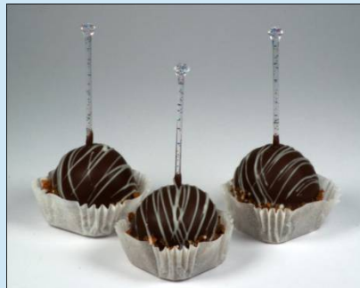
Пирожное «Кейк-попс» 30 гр. Цена: 40 руб.