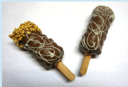
Пирожное «Трубочки» В шоколаде с начинкой 60 гр. Цена: 60 руб.