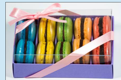
Пирожное «Макароны» Цена: 1750руб./кг.