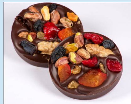
Шоколад с Цукатами 40 гр. Цена: 100 руб.