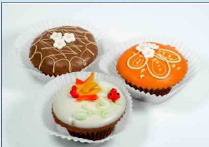
Пирожное «Маффины» 70 гр. Цена: 100 руб.